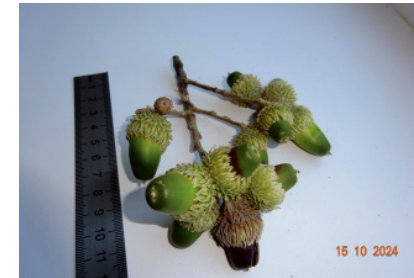
Рис. 2. Скученное размещение желудей дуба каштанового на плодородных побегах

тим, что наши исследования не подтвердили имеющиеся в отдельных публикациях сведения о том, что у дуба каштанового период развития желудей охватывает два вегетационных периода [1, 6].