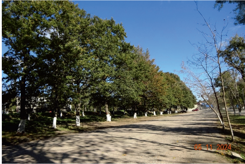
Рис. 1. Аллейная посадка дуба каштанового в пос. Молодёжное Симферопольского района

технологическая академия» КФУ и в аллее длиной около 200 м на сопредельной территории в пос. Молодёжное (рис. 1).