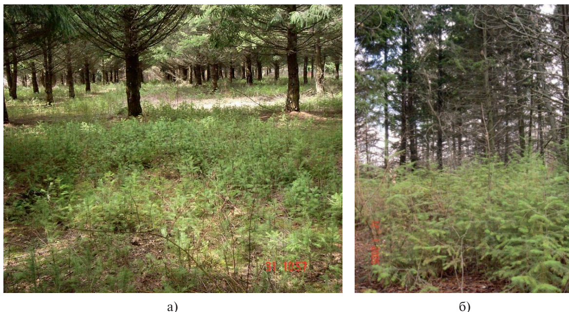
Рис. 3. Самосев псевдотсуги на лесосеменной плантации (а); подрост на сопредельных с испытательными культурами территориях (б)

Можно отметить, что естественное возобновление псевдотсуги в Европе также не является локальным и недавним явлением: оно уже было зафиксировано в Австрии, Болгарии, Франции, Германии, Швейцарии, Великобритании, Италии и Чехословакии с 50-х годов прошлого столетия, а также за пределами Европы – в Аргентине, Чили и Новой Зеландии [29]. В зарубежной практике имеет место использование естественного возобновления как метода лесокультурного производства [5, 27, 28]. В нашем случае даже при наличии обильного самосева не следует ожидать положительных результатов лесовосстановления из-за участвовавших жестких осенних засух со значительным иссушением почвы под пологом насаждения.