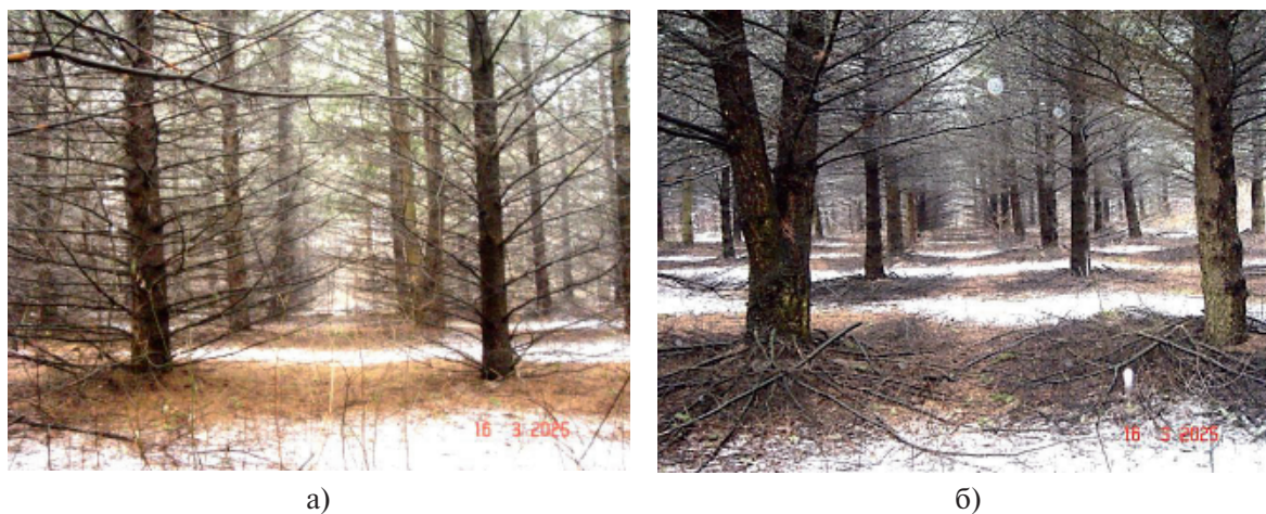
Рис. 4. Лесосеменная плантация псевдотсуги до обрезки ветвей (а) и после (б)

Поднятие кроны на 2 метра на лесосеменной плантации показало, что диаметры сучьев в комлевой части ствола находятся в допустимых пределах для получения ценного пиловочника. При этом следует считать вполне достаточным подъем кроны на высоту 2 м, обеспечивающую прохождение техники и создание отеняющего эффекта на почву для сохранения влаги, в отличие от затратной европейской технологии по удалению ветвей до высоты 10–15 м в случаях с ограниченным до минимума числом деревьев. О дальнейших величинах диаметров и количестве сучьев с увеличением высоты деревьев на объекте можно судить по корреляции диаметра сучка со следующими показателями: возрастом ( r = -0,47 ); количеством сучьев ( r = -0,26 ); диаметром ствола ( r = -0,58 ) и высотой дерева ( r = -0,73 ).